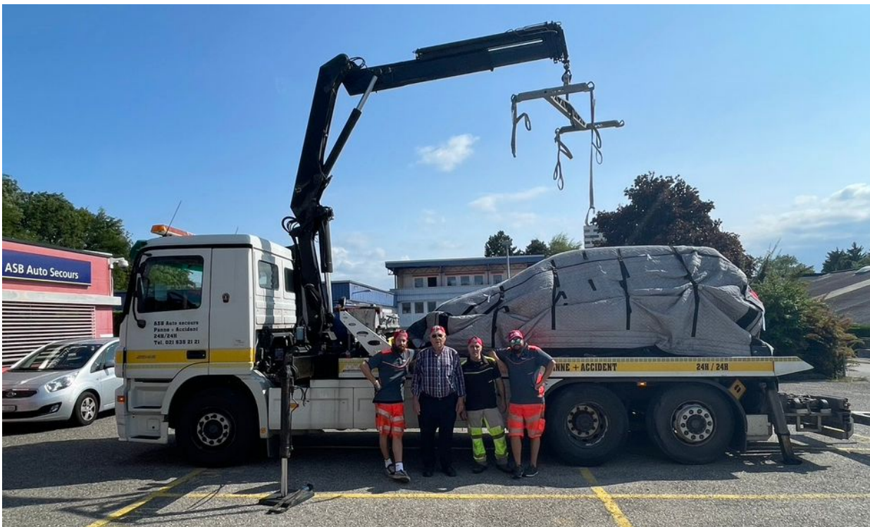
Die innovativen Macher der ASB mit dem LiBaRescue

Dank der weitsichtigen und innovativen Initiative der ECA Waadtland und der ASB Auto Secours wurde per Ende August der erste LiBaRescue und die erste LiBaBoxXL+ aktiv in Betrieb genommen. Die ASB Auto Secours ist stets der ECA Vaud zu Diensten.