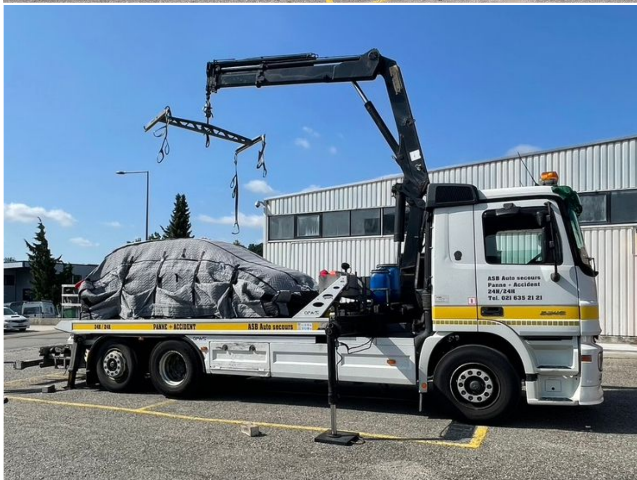
LiBaRescue: Einfaches, sicheres und schnelles Verpacken und Aufladen eines Elektrofahrzeuges