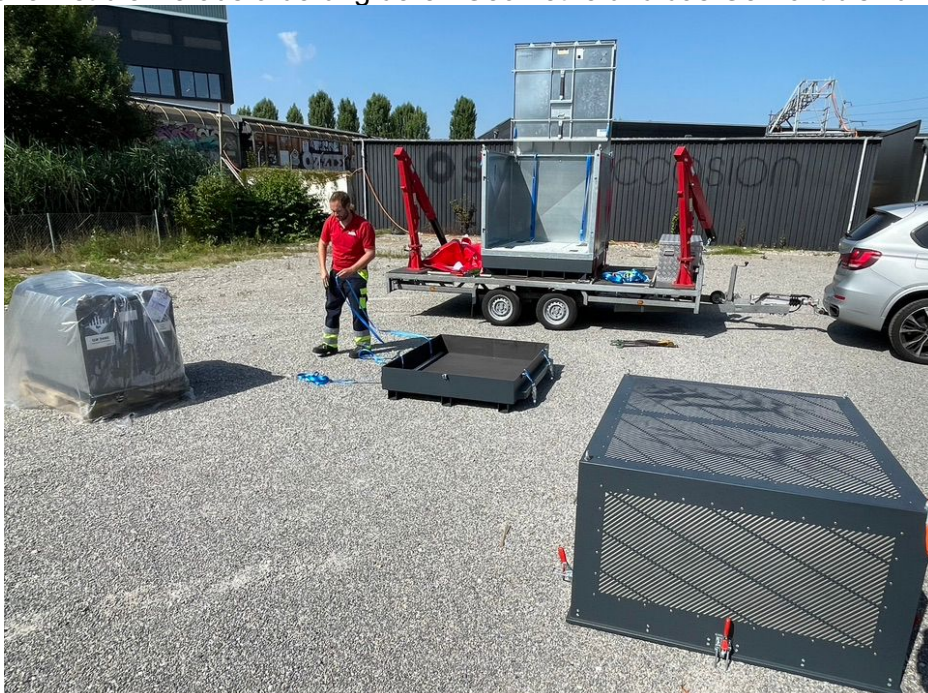
Vorbereitung der ADR Verpackungen zum schnellen Einladen: Batterie, Innen- und Aussenverpackung

Das Betriebspersonal hat vorbildlich die Lithium- Ionen Staplerbatterie ausgesondert und an einen weitläufig abgesperrten Quarantäneplatz gebracht und markiert. Bei der Ankunft wurde zuerst die Staplerbatterie überprüft und wurde als defekt (unkritisch) eingestuft. Aufgrund der Einstufung musste gem. ADR eine zugelassene Aussenverpackung, LiBaBox XLj, und Innenverpackung, LiBaSafeXLj, verwendet werden. Bei Staplerbatterien ist die Herausforderung deren Geometrie und das Gewicht bis zu 1500kg.