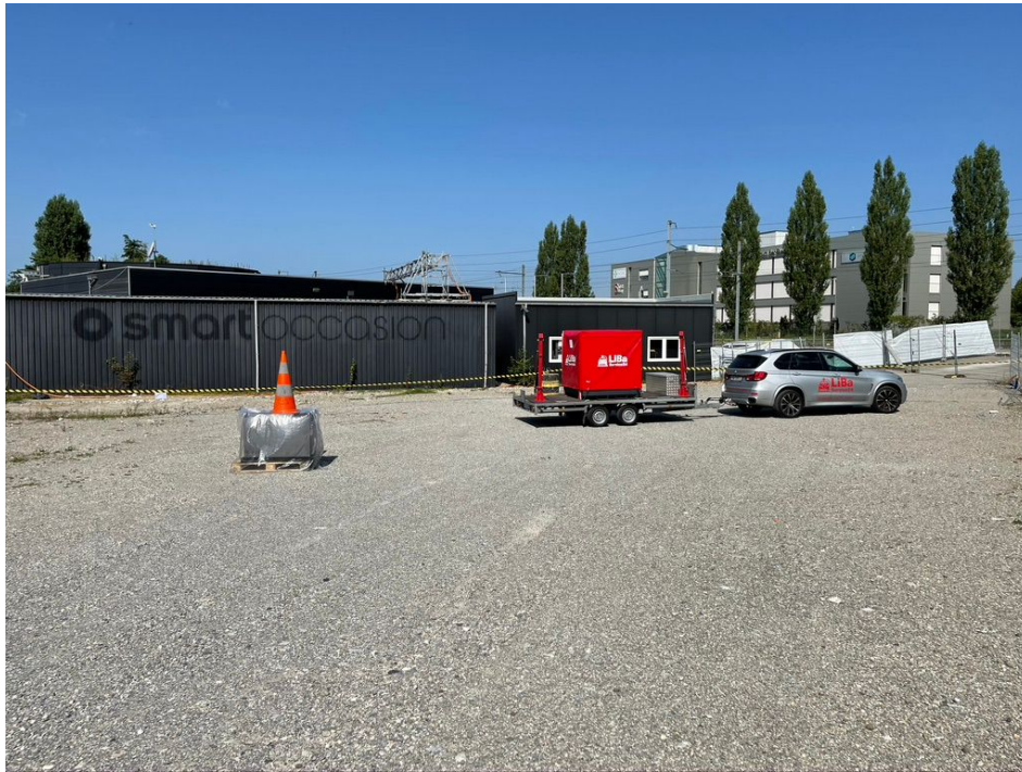
LiBaTrailer mit Box XLj und Zugmaschine auf dem abgesperrten Quarantäneplatz

Das Betriebspersonal hat vorbildlich die Lithium- Ionen Staplerbatterie ausgesondert und an einen weitläufig abgesperrten Quarantäneplatz gebracht und markiert. Bei der Ankunft wurde zuerst die Staplerbatterie überprüft und wurde als defekt (unkritisch) eingestuft. Aufgrund der Einstufung musste gem. ADR eine zugelassene Aussenverpackung, LiBaBox XLj, und Innenverpackung, LiBaSafeXLj, verwendet werden. Bei Staplerbatterien ist die Herausforderung deren Geometrie und das Gewicht bis zu 1500kg.